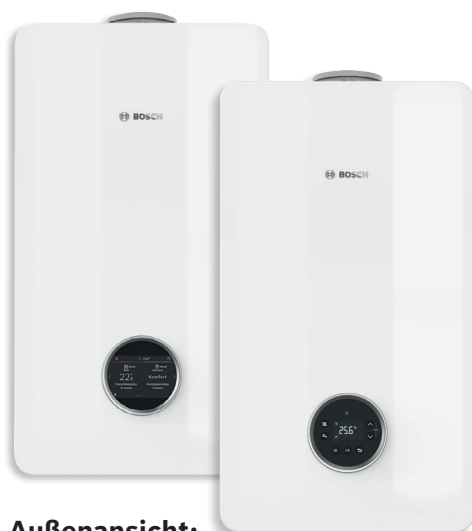
Außenansicht: GC5300i W/GC5800i W

Sie möchten eine neue, energiesparende Heizung für Ihr Zuhause und diese ganz einfach per Smartphone oder Tablet bedienen? Dann ist die Condens 5300i W/5800i W genau das Richtige für Sie.